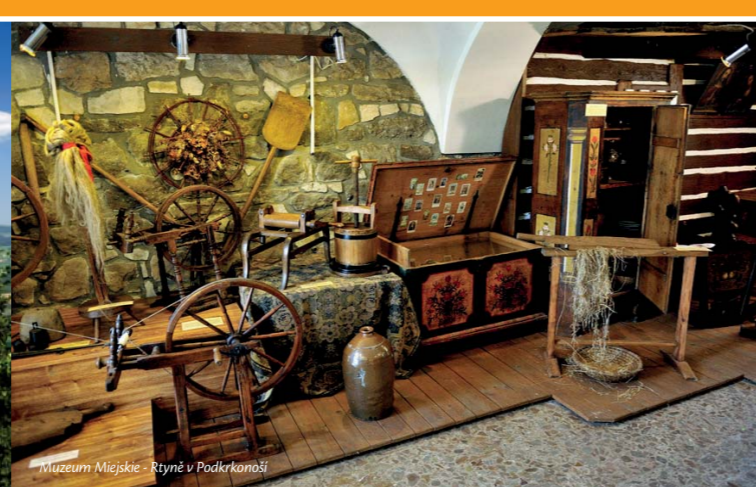
Muzeum Miejskie - Rtně v Podkrkonoší