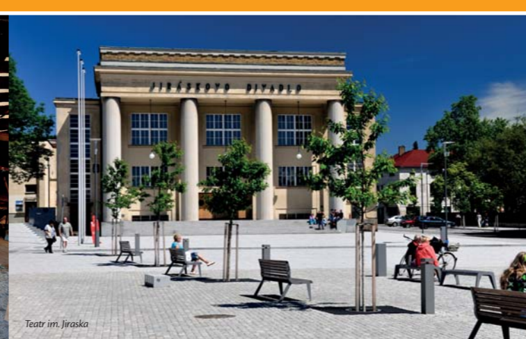
Teatr im. Jiráska