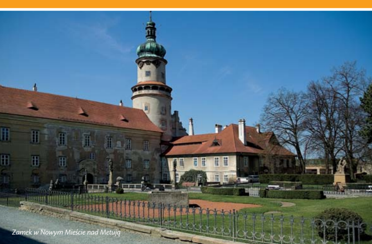
Zamek w Nowym Mieście nad Metują