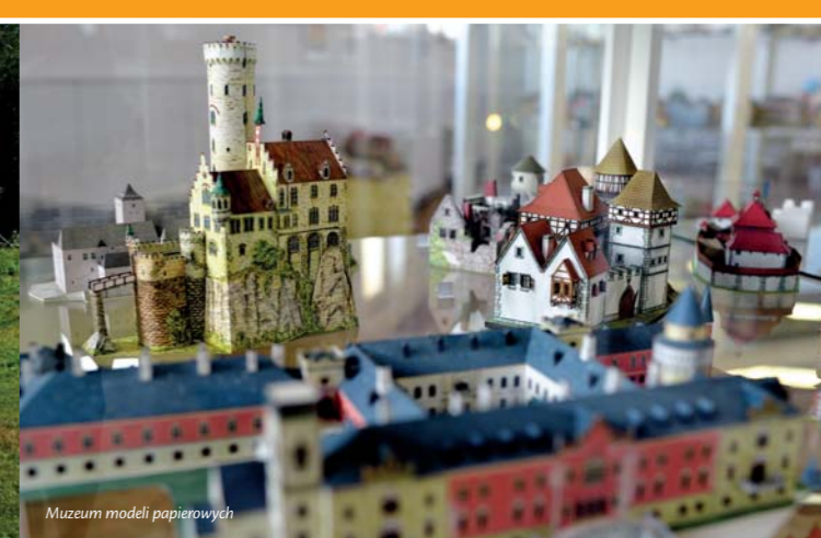
Muzeum modeli papierowych