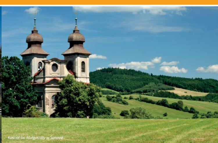
Kościół św. Małgorzaty w Sanovie